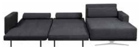
Ecksofa Copperfield Links B298, T153, H79, SH42 cm