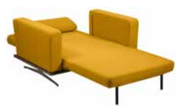
Schlafsessel Copperfield Plus B122, T85, H79, SH42 cm