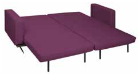
Schlafsofa Copperfield B213, T85, H79, SH42 cm